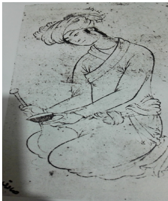
«جوان نشسته با تنگ»، صادق بیک

همچنین رضا عباسی، یکی از نقاشان بزرگ دوره صفوی است که به زندگی روزمره و عادی توجهی خاص دارد و خود نیز زندگی در کنار آنان را دوست دارد؛ تا آنجا که برای مدتی، زندگی در قصر و حمایت شاه عباس کبیر را رها کرده، به میان مردم می‌رود و موضوع برخی از نقاشی‌هایش را از آنجا می‌یابد. یکی از تصاویری که از او به جا مانده، طراحی شگفت‌آوری از یک قرآد یا میمون‌باز دوره‌گردی است که بر یابویی پیر، که با چشم‌های خیره به زمین خشک و بی‌روح به زحمت راه می‌رود، سوار است و میمون آموزش‌دیده‌اش در حالی که روی شانه راستش نشسته است، باید با دلک‌بازی، رقص و تقلید از حرکات مضحک انسانی، مردم را شاد کند (ولش، ۱۳۸۵: ۱۷۹). این نقاشی سرشار از تحرک و پویایی است و توجه به زمین و عناصری است که در دوران قبل ارزش دیده شدن نداشتند.