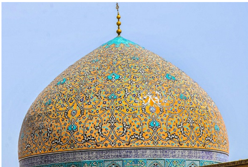
مسجد شیخ لطف‌الله

مسجد شیخ لطف الله و مسجد امام، دو مسجدی است که از روزگار شاه عباس به یادگار مانده است. «با نگاه به مسجد شیخ لطفاله آنچه در نگاه اول از نوع نقش‌مایه‌های به چشم می‌خورد، اسلیمی‌هایی است که روی آن به حرکت مشغول‌اند؛ این اسلیمی‌ها از نوع اسلیمی‌های دهان‌اژدری، معروف به اسلیمی دعاخوان می‌باشد - به‌دلیل شباهتش به دست‌های در حال دعا این نسبت را به این نقش می‌دهند - که از پایین گنبد حرکت خویش را آغاز می‌کند و به سمت بالای گنبد که محور کیهانی و مرکز آن می‌باشد، در حرکت است و این حرکت جایی قطع نمی‌شود و تا بالاترین نقطه که صورت دارد، ادامه دارد» (رستمی و محمدپور، ۱۳۹۷: ۹).